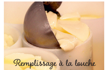
Remplissage à la louche